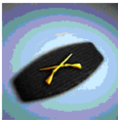
Grade de base Recrue Points requis: 0