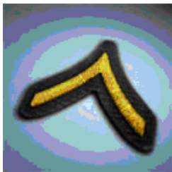
Soldat Points requis: 15